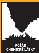
POŽÁR CHEMICKÉ LÁTKY