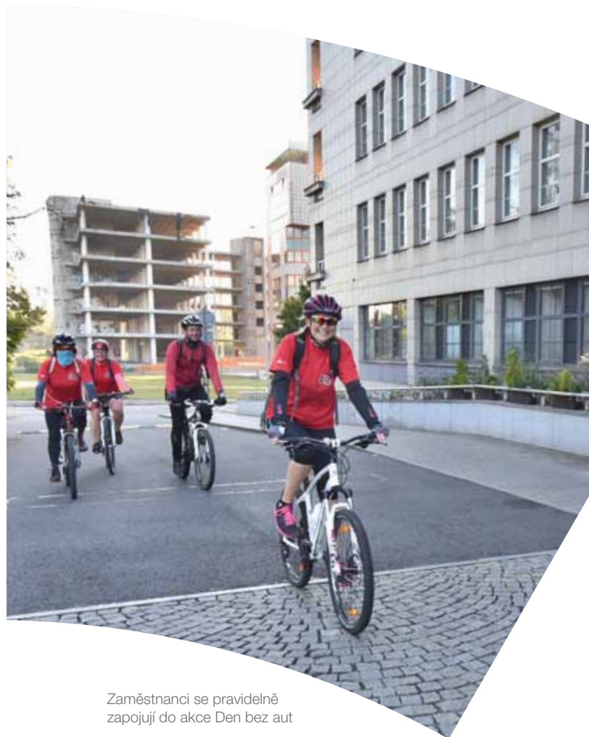
Zaměstnanci se pravidelně zapojují do akce Den bez aut

Dobrovolně se zapojujeme do dalších aktivit přispívajících ke zkvalitnění životního prostředí. Letos na jaře například zaměstnanci kraje zorganizovali akci s názvem „Uklidíme si kousek svého kraje“ a svou prací přispěli ke „zlidštění“ přírodní památky Heřmanický rybník.