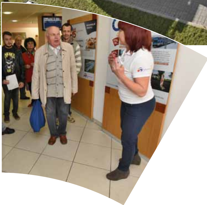
Den otevřených dveří v prostorách krajského úřadu