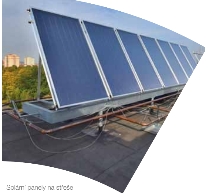
Solární panely na střeše budovy krajského úřadu

Využíváme obnovitelné zdroje energie. Dalším opatřením, kterým přispíváme k ochraně životního prostředí, a zároveň šetříme náklady na provoz krajského úřadu, je chytré řešení v podobě využití sluneční energie. V roce 2015 jsme na střechu budovy úřadu nainstalovali 80 solárních panelů na ohřev vody, které každoročně vyrobí 288 GJ využitelné energie.