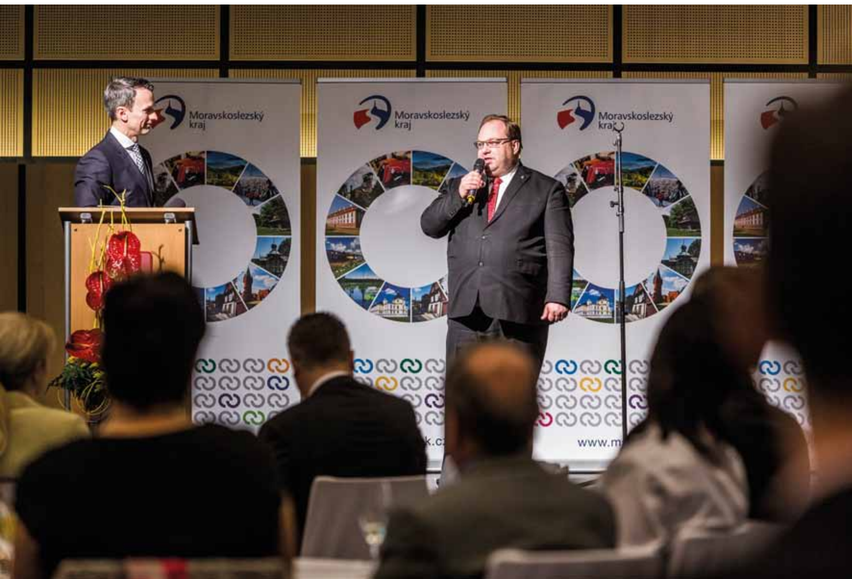
Slavnostní vyhlášení výsledků soutěže o Cenu hejtmána kraje za společenskou odpovědnost