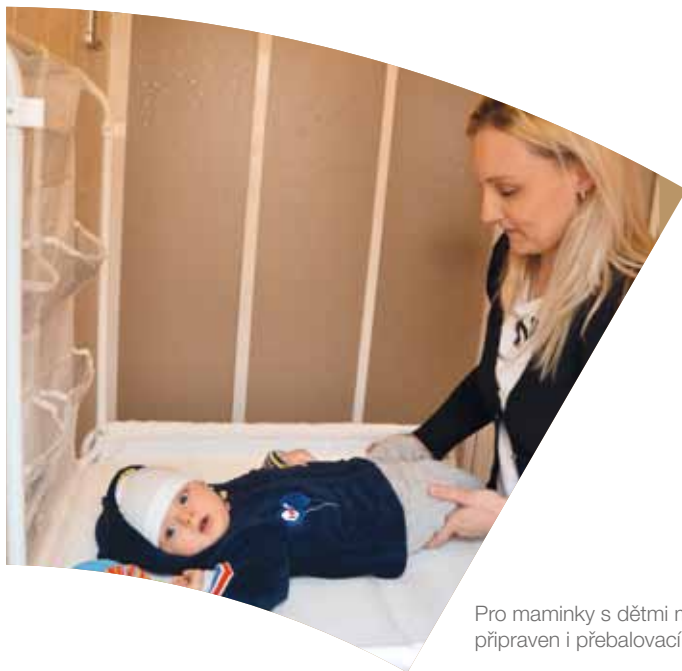
Pro maminky s dětmi máme připraven i přebalovací pult

Chceme, aby lidé měli možnost poznat náš úřad i jinak než jako formální instituci veřejné správy. Proto každoročně pořádáme na krajském úřadě den otevřených dveří. Prostřednictvím této akce přibližujeme zájemcům zábavně-naučnou formou činnost úřadu. Návštěvníci mají možnost prohlédnout si prostory krajského úřadu a diskutovat s politickým vedením Moravskoslezského kraje i vedením úřadu na téma, které je zajímavé. Nejen pro nejmenší je připraven pestrý program.