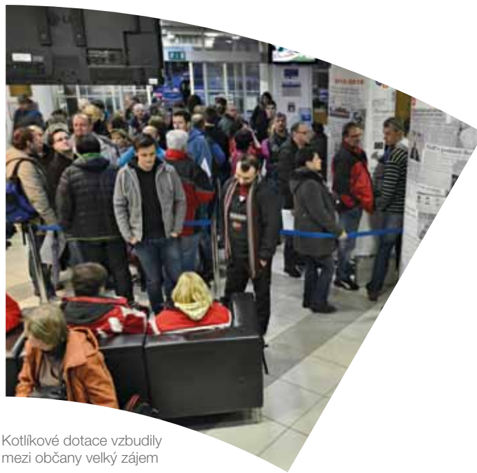
Kotlíkové dotace vzbudily mezi občany velký zájem

V souladu s principy systému řízení šetrného k životnímu prostředí (EMAS) chceme z našeho kraje vybudovat Smart region s aktivitami, které pomohou nejen zlepšit životní prostředí, ale i zjednodušit a zefektivnit život v celém kraji.