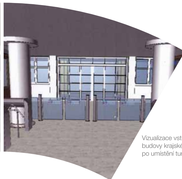
Vizualizace vstupní haly budovy krajského úřadu po umístění turniketů