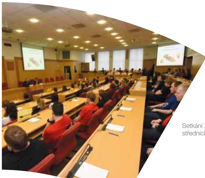
Setkání zástupců vedení kraje se studenty středních škol v prostorách krajského úřadu

Studentům středních a vysokých škol dáváme možnost poznat naše pracovní prostředí a seznámit se s činností krajského úřadu v rámci odborných praxí a pracovních