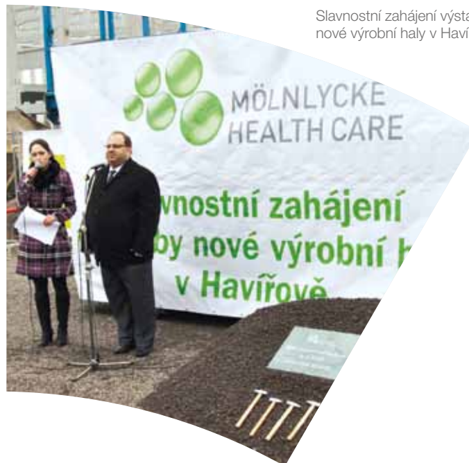
Slavnostní zahájení výstavby nové výrobní haly v Havířově

stáží. Nebojíme se do pracovního poměru přijímat také čerstvé absolventy škol, a umožnit jim tak vybudovat si vlastní profesní kariéru.