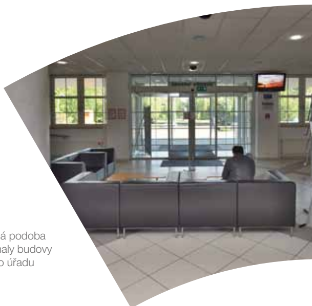
Současná podoba vstupní haly budovy krajského úřadu

System řízení kvality, který jsme na úřadě zavedli, splňuje požadavky normy ČSN EN ISO 9001:2016