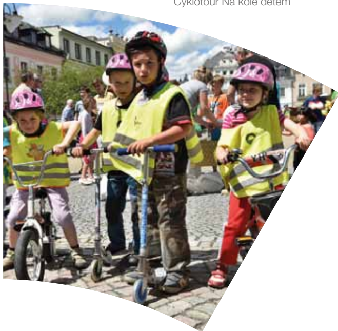
Cyklotour Na kole dětem

k celonárodnímu projektu Okolo měst napříč handicapy na podporu integrace handicapovaných do společnosti. Na závodníky čekala trať dlouhá 54 kilometrů.